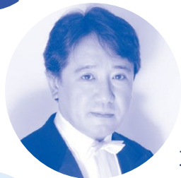
指揮者 末廣 誠