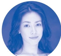
構成・台本/ピエロ他4役 白鳥五十鈴